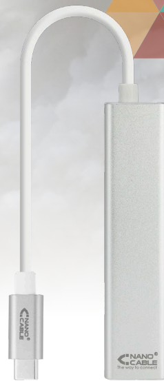
10.03.0404: USB tipo C