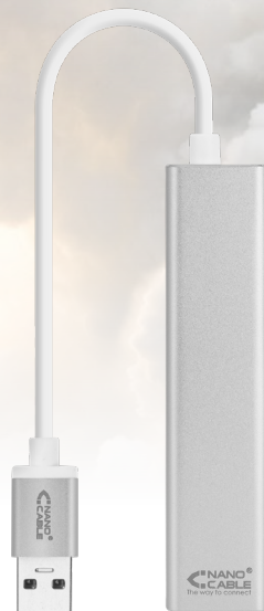
10.03.0403: USB tipo A

Apto para dispositivos USB tipo A o USB tipo C.